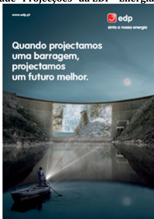
Figura 1 - Publicidade "Projeções" da EDP - Energias de Portugal