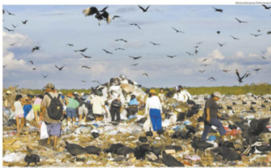
Aterro sanitário de Boa Vista onde indígenas e garimpeiros que saíram de reservas, como a Raposa/Serra do Sol, buscam alimentos ou artigos para vender

Sentado sobre uma lata, uma mulher abota a cabeça quando percebe a chegada da reportagem. Ao seu lado, outra, mais velha, encosta o rosto com